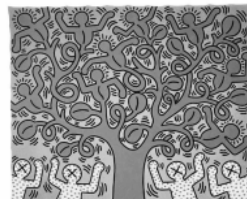
"Tree of Life", 1985