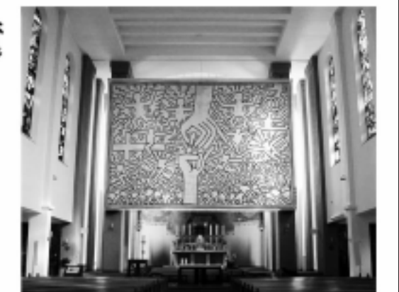
Friedenskirche Urfahr: "The Marriage of Heaven and Hell"